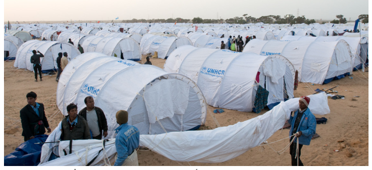
العمال البنجلاديشيين المهاجرين يصلون إلى مخيم عبور رأس جدير على الحدود التونسية مع ليبيا