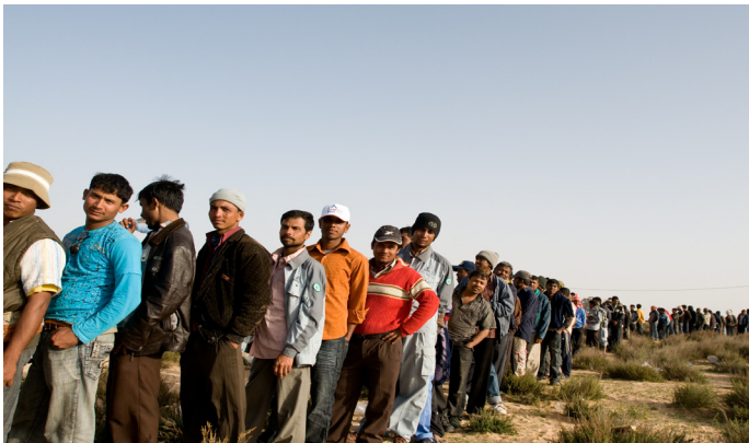
العمال البنجلاديشيين المهاجرين في مخيم عبور في رأس جدير وهم ينتظرون في خط الانتظار لتوزيع المواد الغذائية