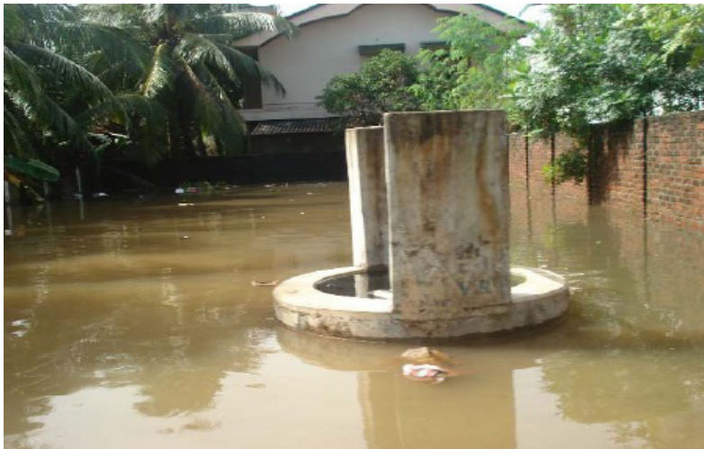
آبار الشرب المتضررة من الفيضانات