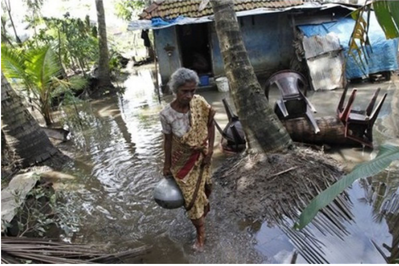
أحد ضحايا فيضانات سريلانكا حمل قدر من مياه الشرب في مجمع مغمور بالمياه في كارينفو